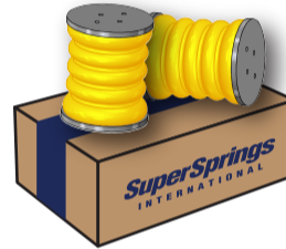
B SUMOSPRINGS REAR SSR-187-54-1