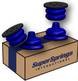
A SUMOSPRINGS FRONT SSF-173-40-2