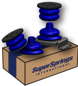
A SUMOSPRINGS FRONT SSF-170-40-2