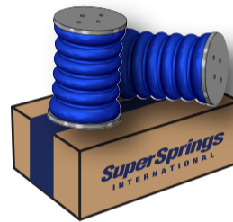
B SUMOSPRINGS REAR SSR-184-40-1